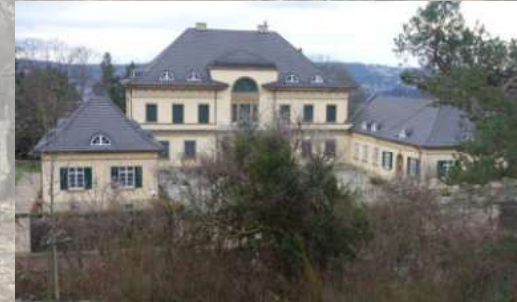
Feuerbacher Heide 40